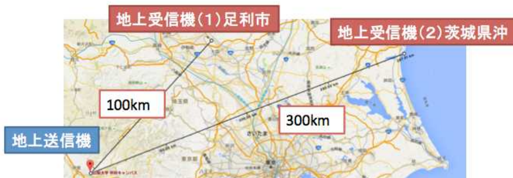
図6 中継通信の実現

気球の高度が14000mに達したとき、2カ所で中継受信が可能になった。気球を介して、それぞれの通信距離は、約100km、約300kmであった（図6）。