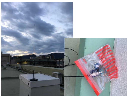
図 4 屋上に設置したセンサノード

2-1, 2-2 で制作した送信機、受信機の評価を行うために、実際に成層圏気球に、中継器を搭載し実験を行った。2-1 で制作した送信ノードを山梨大学工学部の屋上に設置した (図 4)。2016 年 3 月に長野県から気球を放球した (図 5)。送信ノードから出力されたデータを成層圏気球で受信し、そのデータを成層圏気球から地上に送信した。地上の受信機は、足利市および茨城県沖の船に設置した。