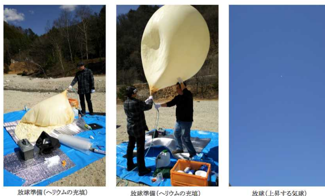
図 5 成層圏気球の放球