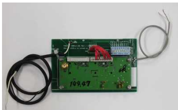
図 2 MAD-SS 小型専用受信機

図 2 は、BPSK 搬送波からオーディオ帯域のスペクトラム拡散信号をとりだす受信機である。重量は、55g であり、消費電力は、平均 0.2W である。周波数安定度は、0.5ppm である。図 3 は、オーディオ信号から送信データを取得するためのマイコンである Raspberry Pi Model A+ と Cirrus Logic Audio Board (Wolfson 社製 Smart Codec with Voice Processor DSP WM5102) である。ソフトウェアは、MAD-SS 受信プログラムおよび pulse audio システムを利用している。重量は、48g であり、消費電力は、平均 0.67W (最大 1.1W) である。